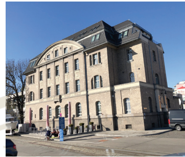
La Casa del Habano im Hafen

Wir sind überzeugt, dass die große Tradition der kubanischen Zigarre eine zweite Casa in Berlin verdient und freuen uns, dass wir auch in schwierigen Zeiten so gut es geht auf kubanische Premiumzigarren zurückgreifen können. Selbstverständlich wird die Casa del Habano am Hafen gebührend eingeweiht werden. Wir hoffen auf regen Besuch aus Kuba, um in diesem Jahr im Spätsommer die