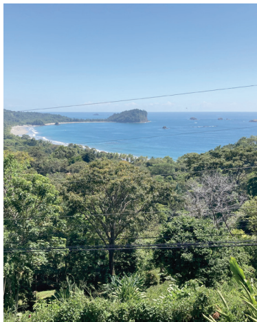
Blick von Quepos (Costa Rica) auf die Pazifikküste

sofort von zwei Polizisten unterbunden. Die WHO soll dem korrupten Staat eine Prämie von einem halben Dollar pro Einwohner bezahlen, um das Land tabakrauchfrei erklären zu können. Dabei ist Costa Rica nicht nur reich an Gold, sondern auch an Tabak und insbesondere-