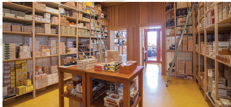
Blick in den Humidor

Eröffnung gemeinsam mit unseren kubanischen Freunden und mit Ihnen zu feiern.