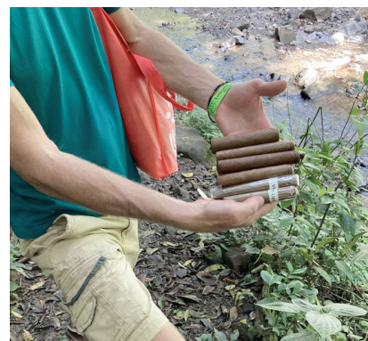
Zigarrenauswahl im Urwald

Herzogs Zigarrenlager am Hafen GmbH & Co. KG Stralauer Allee 9 | D-10245 Berlin www.zigarren-herzog.com | info@zigarren-herzog.com Verantwortlich: Maximilian Herzog Grafiken und Layout: Haiko Kácserek-Maczek Auflage: 2.500 Exemplare Irrtümer vorbehalten